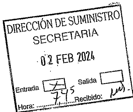
Horacio Pritchard Area Computación

Debe poseer sistema de posicionamiento global integrado que permita geolocalizar las fotos y tener un registro preciso de dónde fueron tomadas